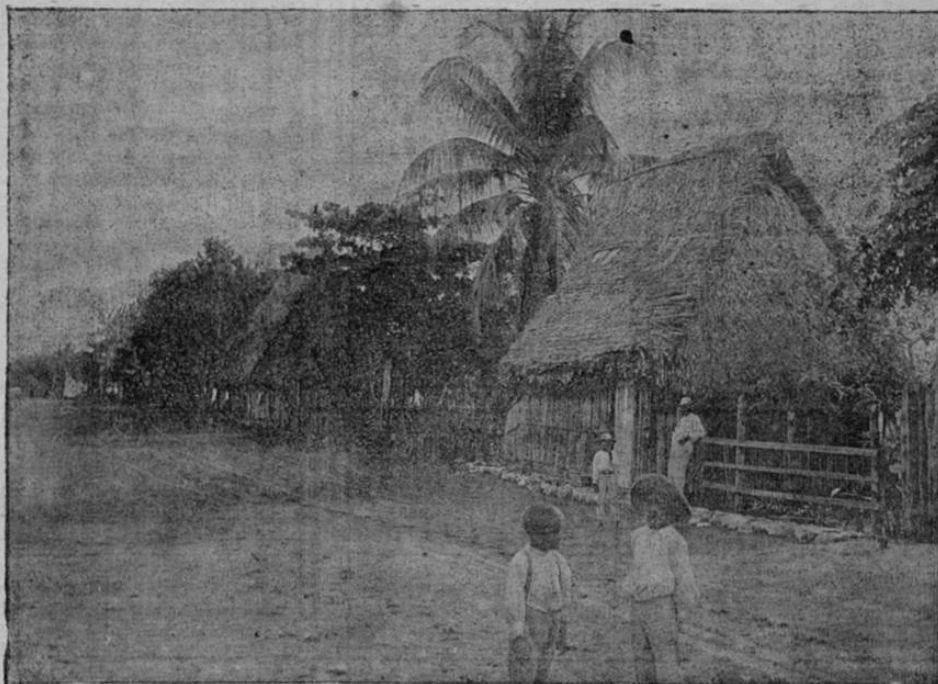
Rancho en que vivió el heroico costarricense ROQUE MENDEZ vilmente asesinado por las tropas invasoras en 1919